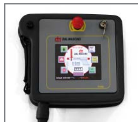
▲ Comando touch screen a colori Touch screen