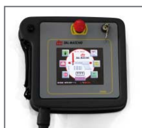
▲ Comando touch screen a colori Touch screen